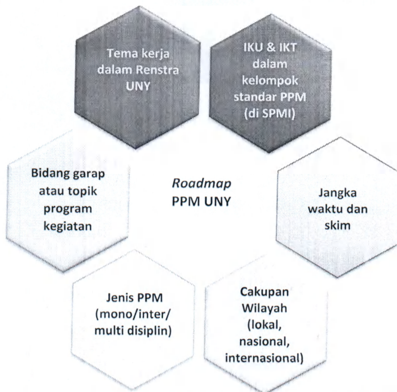
Gambar 2. Komponen-komponen dalam Proses Penyusunan Roadmap PPM

Selanjutnya berdasarkan keenam komponen di atas dapat dikembangkan dan disusun peta jalan (roadmap) program Pengabdian kepada Masyarakat UNY selama 5 (lima) tahun ke depan. Peta jalan tersebut pada intinya adalah milestone kondisi yang diinginkan (atau target) dari seluruh kegiatan PPM UNY setiap tahun hingga 5 tahun kedepan. Untuk memudahkan pembacaan dan pemahaman peta jalan PPM 5 tahun ke depan, dibuat, dan disajikan dalam Tabel 1.